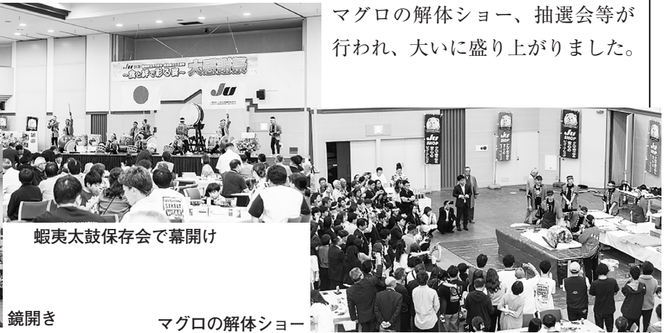
蝦夷太鼓保存会で幕開け