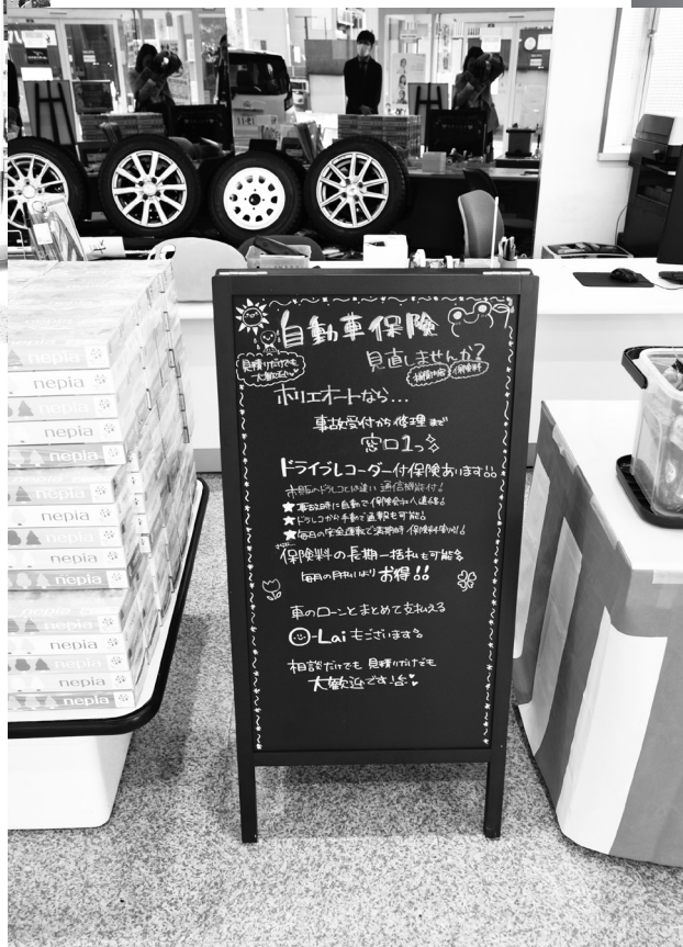
ショールームを入ってすぐに保険提案の看板を置く

当社も保険についてはほぼキャッシュレスに切り替えています。金銭のやり取りについても、透明化をさせることでコンプライアンスを高めています」