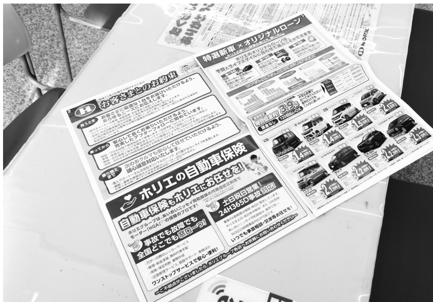
独自のDM「トータルカーライフニュース」で保険について紹介する