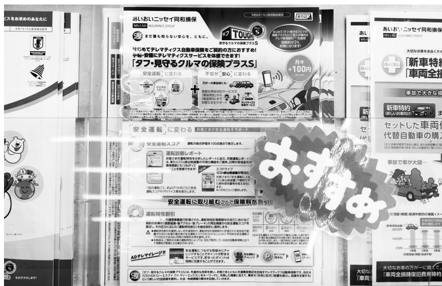
おすすめ商品がわかりやすいように工夫する

部分はあるので、損保が提供するeラーニングなどを活用していきたいと考えています。当社は、保険部の責任者だけが受講するのではなく、全社員に課しています。今後も全社的に意識付けを強化していきたいです」